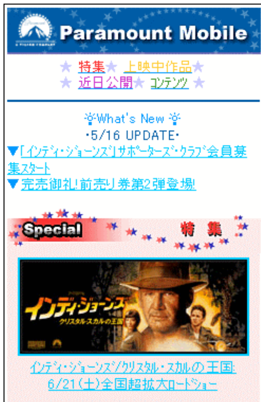
新サイト『パラマウント モバイル』 TOP画面(イメージ)