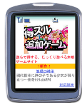
得する追加ゲーム TOP画面(イメージ)