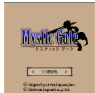
「ミスティックゲート」 トップページ (イメージ)