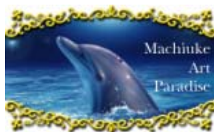
「待受アートパラダイス」 サイトバナー

(C)GignoSystem Japan, Inc. (C)2004 Christian Riese Lassen