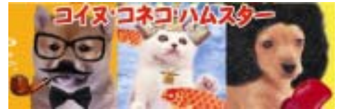
「コイン・コネコ・ハムスター」 サイトバナー