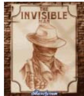
The Invisible Man

今回配信開始いたしますゲーム「The Invisible Man（透明人間）」は、1897 年に『宇宙戦争』『タイム・マシン』などで知られる作家ハーバート・ジョージ・ウェルズが発表した SF 小説『The Invisible Man（透明人間）』をモチーフにした作品です。舞台は 1899 年のロンドン。主人公である「透明人間」がロンドンの街を歩き、再び姿が「見える」ようになる化学薬品を警察に追われながら探す、ハラハラドキドキの RPG ゲームです。