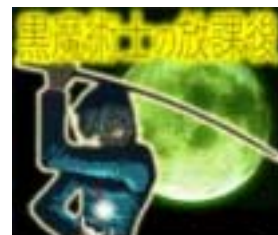
© 2005 Gynnosystem Japan, Inc. © 2005 fupac