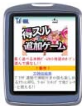
得する追加ゲーム TOP 画面（イメージ）

ストーリーは全十話。ゲーム中には、指定された数字キーを押して描く魔法陣や、決まった順番で敵を倒さないと次へ進めないフロア等が存在します。戦闘では、数字キーで 1~9 の数字を 2 桁入力することで、剣で魔法陣の軌跡を描き攻撃します。描いた軌跡（入力した数字）の組み合わせによって、使い魔を召喚し追加攻撃が発生します。回復や、マニュアルに無い強力な隠し魔法陣も存在します。